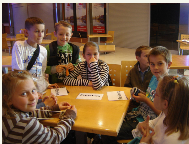
Uczniowie podczas gry edukacyjnej